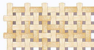
Woven lerakási minta

Csak 5,65 négyzetméteres csomagban kínáljuk.