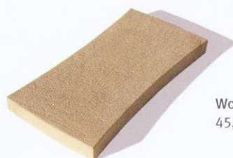
Woven lap 45,5 x 25,3 x 4 cm