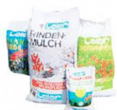
Virágföld / mulcs